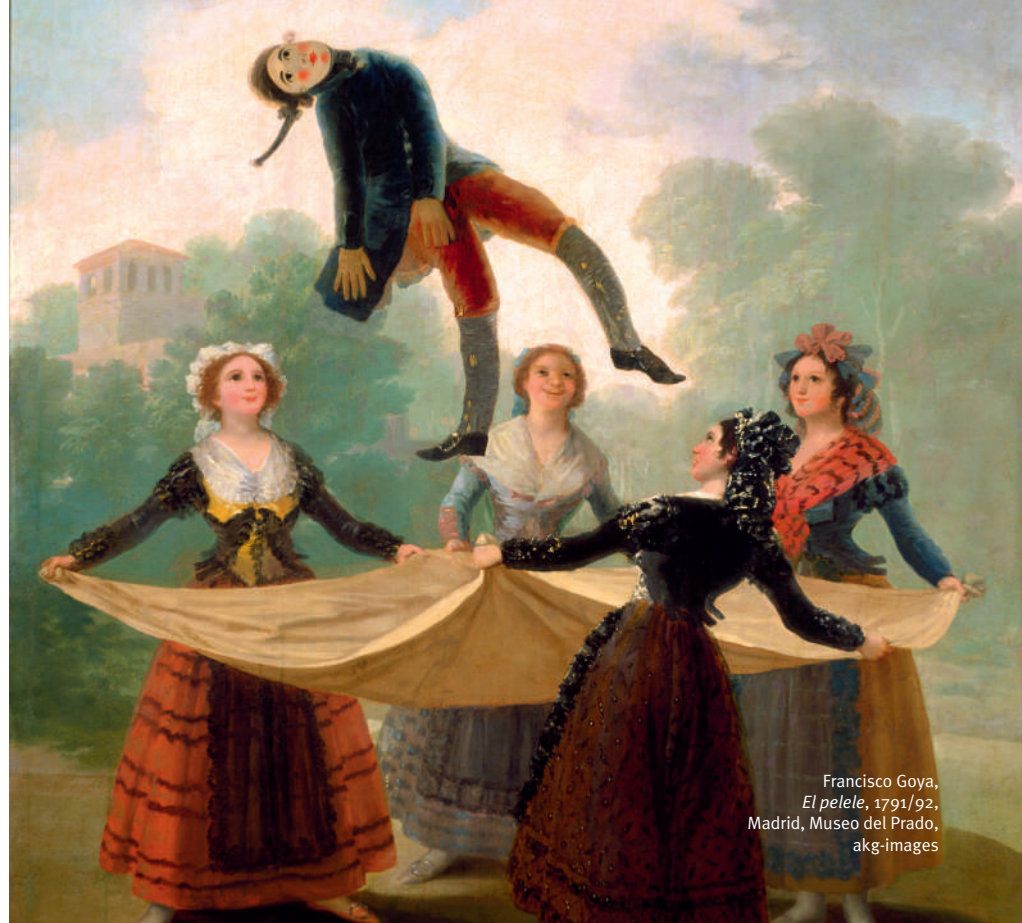
Francisco Goya, El pelele , 1791/92, Madrid, Museo del Prado