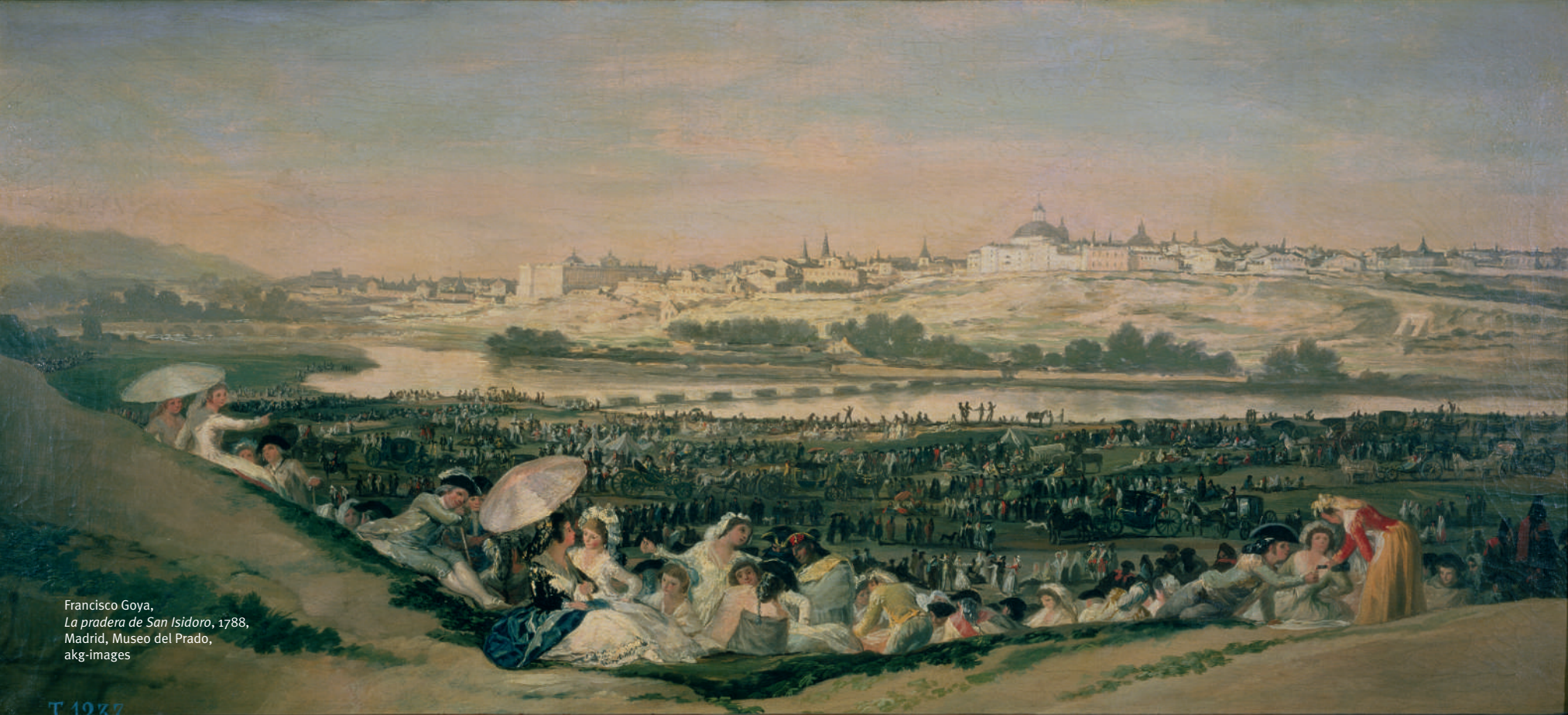
Francisco Goya, La pradera de San Isidoro , 1788, Madrid, Museo del Prado