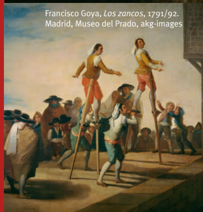
Francisco Goya, Los zancos , 1791/92. Madrid, Museo del Prado